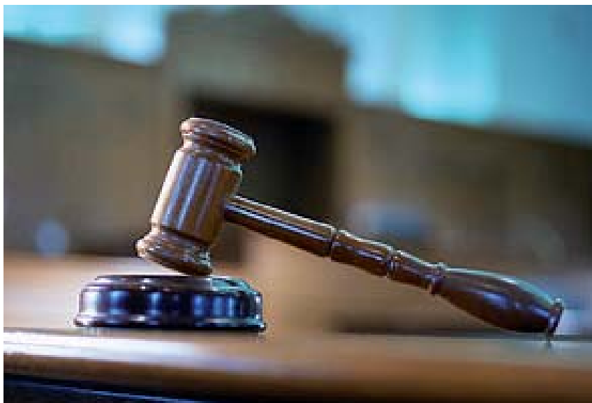
När domstolen avkunnat domen skickas den inom en vecka till Kriminalvårdens frivårdskontor, om domen avser en person som inte är häktad eller i anstalt.

Om en person som dömts till fängelse inte redan är placerad i anstalt för ett annat brott, eller är häktad, är han eller hon på fri fot även efter att domstolen meddelat sin dom. Detta gäller i regel de som dömts för brott som ger mindre än ett års fängelse. Är man misstänkt för ett brott som kan ge fängelse i minst ett år eller kan befaras förstöra bevis, försvåra utredningen eller fortsätta den brottsliga verksamheten, är man vanligtvis häktad.