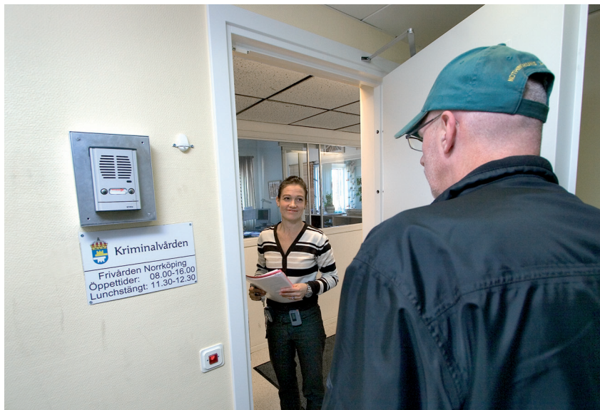
Frivård innebär kontroll och stöd. En klient anländer till frivårdskontoret.

F rivård är kriminalvård i frihet. Frivården övervakar