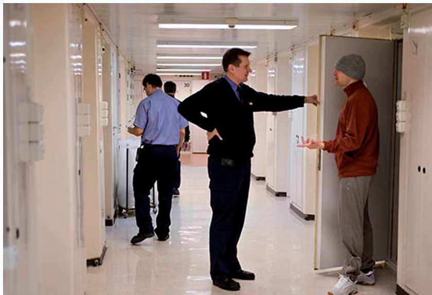
Det är sällan lugnt i en häkteskorridor. Bilden är från häktet i Norrköping.

I häkte sitter personer som misstänks för att ha begått brott och som häktats av domstol. I häktena kan också finnas gripna, anhållna, asylsökande som ska avvisas samt missbrukare eller psykiskt sjuka som tvångsomhändertagits och ska placeras på institution. Om den häktade döms för brottet som han eller hon misstänks för, inleds planeringen av verkställigheten av straffet redan i häktet.